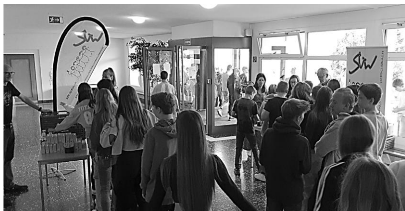
Znüniaktion 2023: Der Verein offerierte allen Schülerinnen und Schülern sowie Lehrpersonen eine Pausenverpflegung